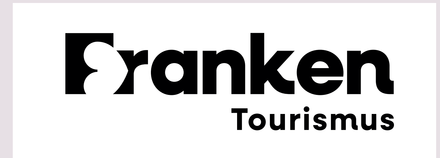
Logo schwarz (nur in Ausnahmefällen)